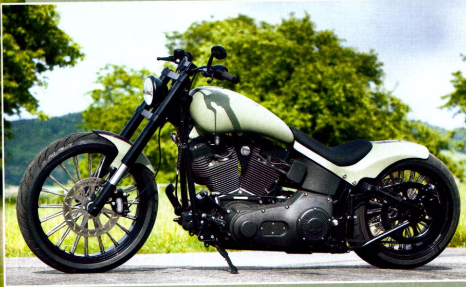
Die klaren Linien werden durch die radial gespeichten Räder perfekt unterstrichen. Perfekt integriert: Infozentrale in der Riserklemme